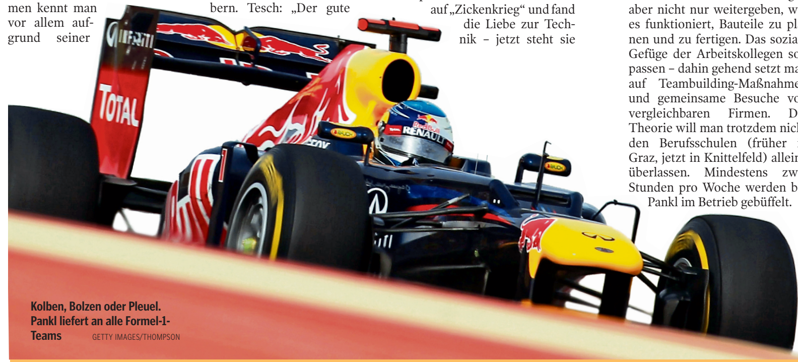
Kolben, Bolzen oder Pleuel. Pankl liefert an alle Formel-1-Teams