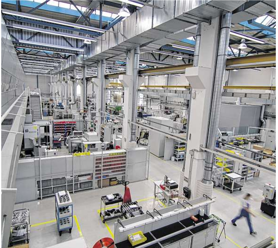
Die Produktionshalle bei Pankl in Kapfenberg, wo auch Hightech für die Formel 1 hergestellt wird